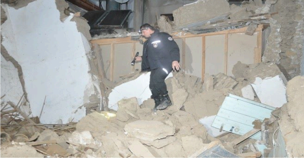
Fotoğraf 5: Surlariçi'nde Çöken Ev ("Surlariçi'nde Ev Çöktü", 2016).

"Surlariçi bölgesinde geçen hafta içinde yıkılan iki katlı ev, gözlerin bakımsızlıktan harabeye dönen başka evlere ve tarihi binalara çevrilmesine neden oldu... Bölge halkı, her an yıkılacak gibi duran evlerin can ve mal güvenliklerini tehdit ettiğini söylüyor" ("Birçok Bina Çökmek Üzere", 2017).