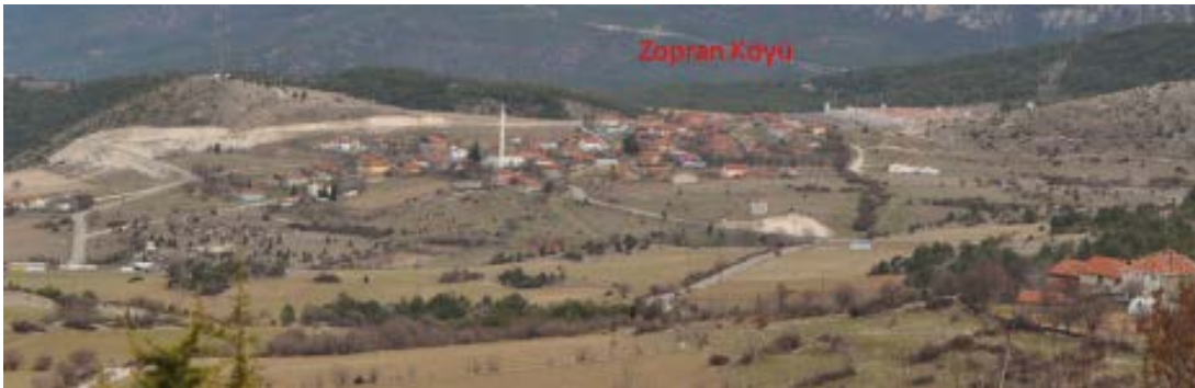
Resim 12. Akören Köyü'nden Doğudaki Zopran Köyü'ne Bakış (Gür ve Yıldırım, 2017)

Bizans döneminde iç Paphlagonia olarak ifade edilen yerleşim alanları, savunma açısından büyük öneme sahiptir. Devrek, Akören, Safranbolu, Araç, Daday ve Kastamonu kaleleri bölgenin savunma hattı hakkında bilgi sunmaktadır. Aynı ulaşım ađında yer alan bölgelerin kale yapıları da stratejik konum açısından önemlidir (Karauđuz ve Özcan, 2010: 84-85) (Resim 12). Gözlemlerimiz doğrultusunda Zopran Köyü'nde çeşitli ölçülerde sütun, bloктаş ve birkaç mimari plastik eser tespit edilmiştir.