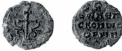
Resim 10. Sora Piskoposu Symeon'a ait Kurşun Mühür

Diğer kurşun mühür de Sora piskoposu Symeon'a (yaklaşık 10. yüzyıl) aittir. 20 mm. çapında ve 4.51 gr. ağırlığına sahip mührün ön yüzünde, merkezde üç basamaklı bir kaide üzerinde (Golgotha Tepesi) patrik haçı ve iki yanında dalgalı şekilde yükselen fluronlar, üst bölümü süsleyen paletler ve çevrede bordür yer alır. Önde +ΚΕΡ.....ΥCΥΔΟΝΛΥ., arka yüzde ise dört satırlık +CV.ΙΕΥΝΕΠΙCΚΟΠΥCΙΟΡΥΝ|... Κ(ύρι)ε β[οή]θει τ[ῷ] σ[ω] δούλ[ῳ] Συ[μ]εὼν ἐπ[ι]σκόπῳ Σορῶν. yazar (McGreer, Nesbitt, Oikonomides, 2001: 53 Fig. b) (Resim 10).