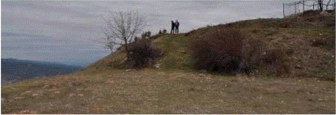
Resim 2. Akören Köyü, Kale Doruk Mevkii (Yıldırım ve Gür, 2017)

Akören'in kuzeyinde, günümüzde üzerinde birkaç yapının yer aldığı arazi Kale Doruk Mevkii olarak adlandırılmaktadır. Araştırmalar doğrultusunda yer yer devşirme eserlerin bulunduğu alan, yaklaşık 20-30 yıl öncesinde iş makineleri tarafından düzleştirilmiştir (Resim 2).