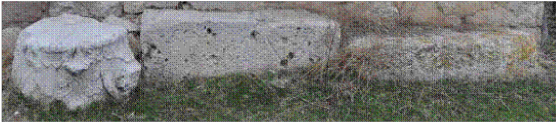
Resim 4. Hüsnü Efendi'nin Evi Önündeki, Korint Sütun Başlığı ve Mimari Eserler (Gür ve Yıldırım, 2017)

Büyük ölçüde hasar görmüş olan başlık günümüzde Kaleköy'ün merkezinde Hüsnü Efendiler (1950'li yıllarda köy ağası) evinin avlusunda yer almaktadır. Yapımın inşasında birçok devşirme bosaj teknikli blok taş ve düzgün kesme taş malzeme görülmektedir. Ayrıca Akören'de gerçekleştirilen araştırmalarda Hüsnü Efendi'nin evi önündeki devşirme malzemelerin birinde taş ustasının izi görülür (Resim 4).