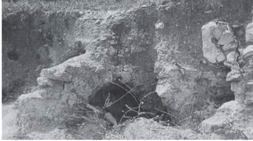
Resim 3. Sora, Akropolis Mimari Kalıntılar (Belke, 1996: Taf. 114)

Sora'ya 2.5 km. mesafede ve toprak altında Roma nekropolü yer almaktadır. Tahrip edilen mezarların bazılarının kapı kanatları açıktır ve mezar odaları görülür. Sora'da görülen diğer bir gömü alanında ise çeşitli sütunlar ve mezar kitabesi yer almaktadır. Tespit edilen Roma kalıntıları büyük ölçüde Amasya Müzesi örnekleriyle benzerlik gösterir (Belke, 1996: 273). Modern yerleşimden biraz uzakta yer alan mezar yapıları uzun yıllar kaçak kazıcılar ve hayalperest define avcıları tarafından tahrip edilmiş ve hala da kazılmaya devam ettikleri anlaşılmaktadır.