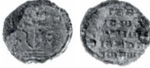
Resim 8. Sora Piskoposu Leontios (yaklaşık 10.-11. yüzyıl)

McGreer, Nesbitt ve Oikonomides çalışmalarında Sora piskoposlarının kurşun mühürlerine yer vermiştir;