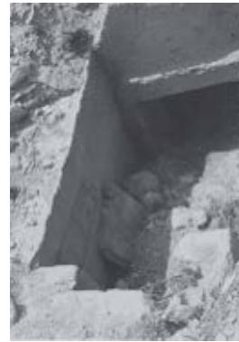
Resim 7. Sora, Tahrip Edilmiş Mezar (Belke, 1996: Taf. 115)