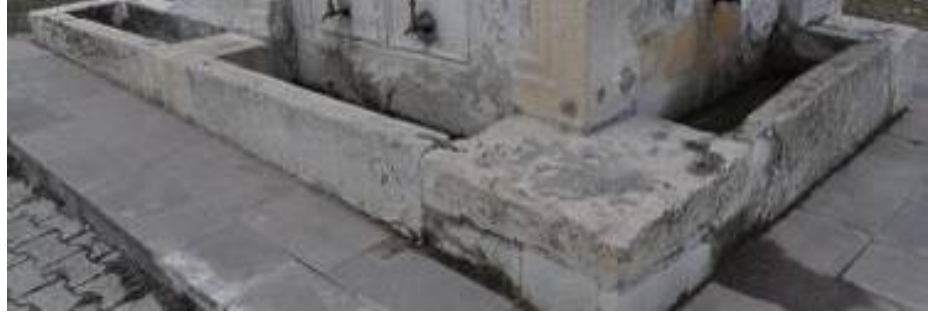
Resim 5. Akören Köyü, Hüsnu Efendi Evi, Devşirme Malzemeler (Yıldırım ve Gür, 2017)