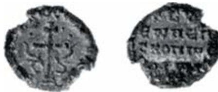
Resim 9. Sora Piskoposu Symeon'a ait Kurşun Mühür

Sora piskoposu Symeon'a (yaklaşık 10. yüzyıl) aittir. 20 mm. ölçülerinde ve 4.89 gr. ağırlığındadır. Ön yüzde, üç basamaklı bir kaide üzerinde (Golgotha Tepesi) merkezde patrik haçı ve iki yanında dalgalanarak yükselen fluronlar, üst bölümü süsleyen peletler ve çevrede bordür yer alır. Ön yüzde bordürde +ΚΕΡ.....CΥΔΟΝΛΥ., arka yüzde ise dört satır halinde +CΥ..|ΕΥΝΕΠ|CΚΟΠΥC|ΟΡΥΝ|... Κ(ύρι)ε βο[οή]θ(ει) τ[ῷ] σῷ δούλῳ Συ[μ]εῶν ἐπ[ι]σκόπῳ Σορῶν. yazmaktadır (McGreer, Nesbitt, Oikonomides, 2001: Fig a) (Resim 9).