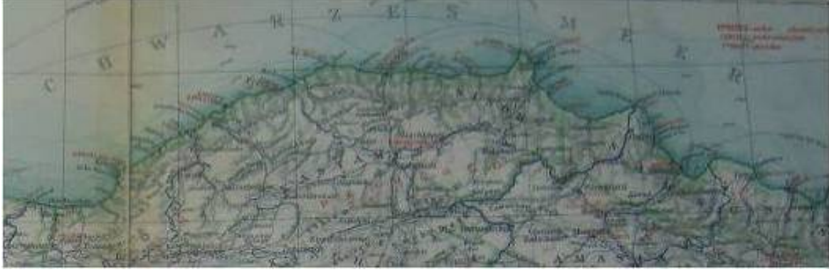
Harita 1. Karadeniz Bölgesi Yerleşim Alanları (Ruge ve Friedrich, 1899: Map)

Sora'nın Roma dönemi için Gangra, Dadybra ve Hadrianoupolis'in Paphlagonia'daki konumunu incelemek gerekir.