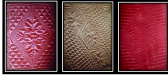
a: Çerçeveli gül

altılı yıldız vb. şekiller kullanılmaktadır. Bunun yanı sıra Kemerhisar yorgancılığında; salyangoz, kuş ve tavus kuşu gibi figürlü desenler ile mekik çarkifelek, yelpaze, “s” kıvrım, deniz dalgası, badem şekeri, güneş, fiyonk gibi nesneli desenlerin yer aldığı örnekler de görülmektedir. Ancak belirtilen bu desenlerin birçoğunun günümüzde uygulaması ya azalmış ya da tamamen bitmiştir. Genelde daha çok geometrik desenli yorganlar diktirilmektedir.