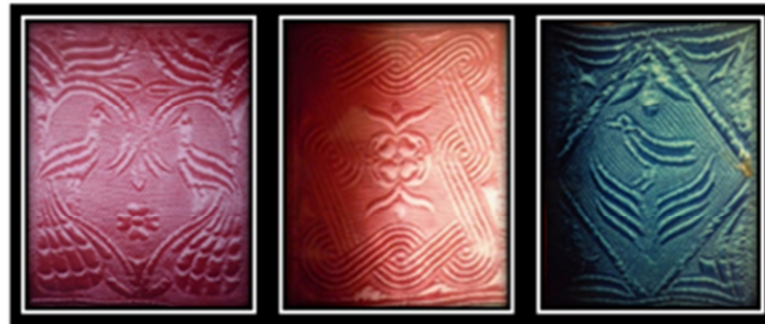
a: Tavus kuşu

Fotoğraf 5’de geometrik desenli yorgan örneklerinde biri yer almaktadır. Bu örnekte yorganın tamamında kaydırılmış eksen düzeninde yıldız motifi kullanılmıştır. Yıldız motifli yorgan günümüzde yörede en çok dikimi yapılan modeldir. 180x220 cm. ebatlarında, yorgan yüzü saten kumaştan, astarı patiskadandır ve dolgu malzemesinde pamuk kullanılarak 2007 yılında yapılmıştır. Modelde kullanılan renk yavruağzı, uygulanan dikim tekniği de oyulgama tekniğidir.