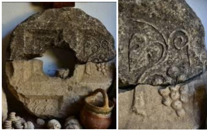
Resim 6. Üçbölük Köyü, Mezar Steli, 2017

Kimistene’de bulunarak Çankırı Müzesi’ne taşınan iki stel (Lafli ve Christof, 2012: 21, Abb. 37 c-d) ve Kastamonu/Taşköprü’de yer alan stelin (Waelkens, 1986: 305-306), Üçbölük Köyü Kültür ve Sanat Merkezi’ndeki stel ile benzer özelliklere sahip olduğu görülür.