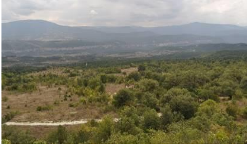
Resim 1. Karabük, Soğanlı Vadisi, Genel Görünüm, 2017

(Safranbolu'nun güneyinde yer alan Üçbölük köyünün de içinde bulunduğu Soğanlı Vadisi) zengin arkeolojik buluntulara rastlanılmıştır (Resim 1).