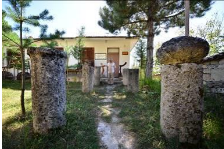
Resim 5. Üçbölük Köyü, Kültür ve Sanat Merkezi, Mimari Plastik Eserler, 2017

Roma ve Erken Bizans Dönemi'ne ait kalıntıların çoğu Recai Demirses tarafından yoğun çaba ve uğraşlarla oluşturulan, tarihi köy okulunun yerine inşa edilmiş Üçbölük Köyü Kültür ve Sanat Merkezi'nin bahçesi ile köyün batısındaki mezarlıkta bulunmaktadır. Kültür ve Sanat Merkezi'nin bahçesinde yer alan sütunlar da bölgede Roma-Erken Bizans Dönemi yapılarına aittir (Resim 5). Kültür ve Sanat Merkezi'nde 2.-3. yüzyıla tarihlendirilen sütun başlığı, yöredeki Roma varlığına işaret etmektedir.