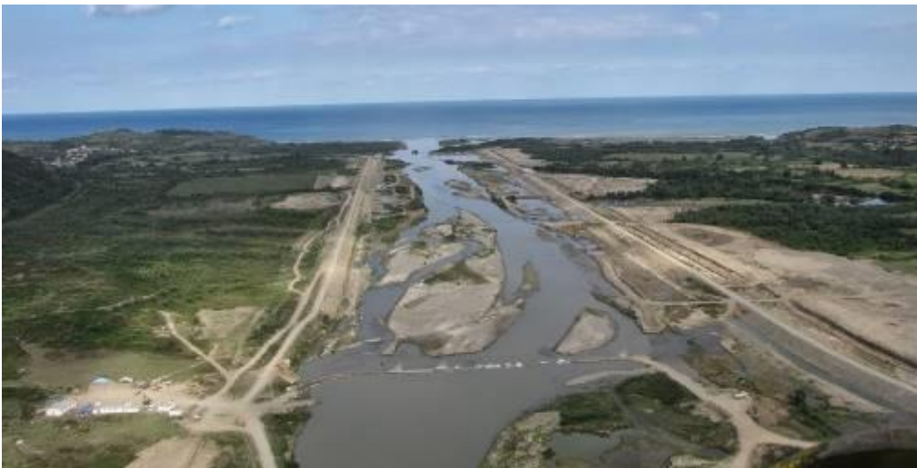
Resim 8. Filyos (Billaios) Nehri

Uzun yıllar ticarete kullanıldığı belirlenen Filyos Nehri zamanla önemini yitirmiş, debisi dolarak ulaşım güzergahı olmaktan çıkmıştır (Fowler, 1902: 351; Bryer ve Winfield, 1985: 4-5, 67, 69-70; Gür, 2019: 271). Günümüzde debisi dolarak ulaşımı imkânsız hale gelen Filyos Nehri'ni, günümüz koşullarıyla değerlendirmenin doğru olmayacağı düşünülmektedir (Resim 8).