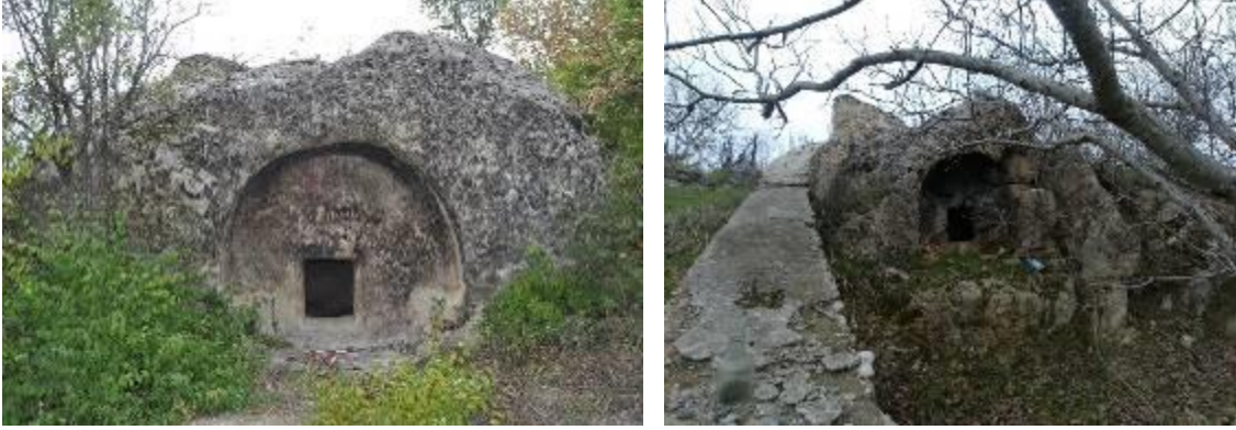
Resim 2-3. İncirli taş Kaya Mezarı (Sol), Üzümlü İn Kaya Mezarı (Sağ), 2017

adlandırılan iki kaya mezarı, plan ve ikonografik açıdan ele alınmış, tüm bu veriler ışığında Üçbölük'teki kaya mezarları 2.-3. yüzyıla tarihlendirilmiştir (Yıldırım, 2018:325-344) (Resim 2-3).