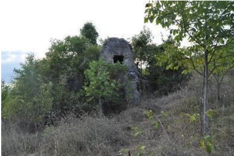
Resim 4. Safranbolu, Üçbölük Köyü, Kutsal Kaya Yapısı, 2017

2017 yılında Üçbölük'teki Roma Dönemi nekropol alanının güneyinde bulunan kutsal kaya yapısı üzerinde incelemeler gerçekleştirilmiş ve ilk defa tarafımızca 2018 ve 2019 yıllarında bildiri olarak sunulmuştur (Yıldırım, 2019: 513-529; Yıldırım-Gür, 2019: 183-184) (Resim 4). Köyün yaklaşık 300 m batısındaki Roma Dönemi'ne tarihlendirilen kaya yapısının, ilk inşa edildiği dönemde dinsel amaçlar doğrultusunda kullanıldığı sonrasında ise şarap işliğı ve kutsal haç tasvirli kaya yapısı olarak işlevini devam ettirdiği öğrenilmiştir.