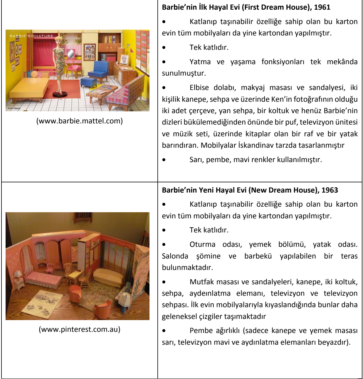
Tablo 1: Seçilen yedi Barbie evinin mekânsal özellikleri