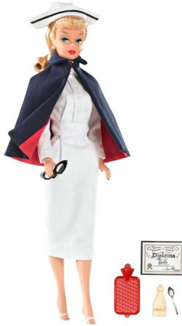
Şekil 2: Hemşire Barbie( www.barbie.mattel.com )

1974 yılında iflasın eşiğine gelen Mattel, 1975-76 yıllarında çeşitli çalışmalarda bulunmuş olsa da, esas çıkışını 1980'li yıllara gelindiğinde yapmıştır. Kendi içinde bir değişime gitmiş ve cinsiyet ayrımcılığı içeren reklamlarını ve stratejilerini değiştirmiştir. Barbie, My Favourite Career (Kariyer Bebekleri) adı verilen koleksiyon dahilinde veteriner, cerrah, mühendis, öğretmen, rock yıldızı, pilot, diş doktoru, balerin, astronot gibi mesleklere sahip olarak ortaya çıkmış ve toplamda 150 farklı kariyere sahip olmuştur. Yine de bu değişim bebeğin dış görünüşü ve yaşam tarzı değiştirilmediğinden yetersiz kalmıştır. Ancak yalnızca tüketen kadın imajı, kariyer sahibi, başarılı ve üreten kadın imajına doğru evrilmeğe başlamıştır. 'Biz kızlar istediğimiz her şeyi yapabiliriz, değil mi Barbie?' sloganıyla kadının girişimcilik yönüne vurgu yaparak kendine yeni bir strateji oluşturulmuştur (Campbell, 2014).