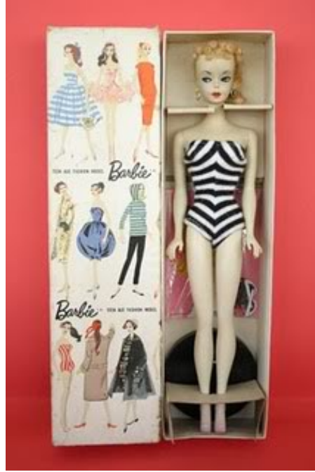
Şekil 1: 1959'da satışa sunulan ilk Barbie

ve beyaz bir güneş gözlüğü vardır (Driessen, 2016). Barbie 1959 yılında piyasaya sarışın ve koyu renk saçlı olarak 2 versiyon olarak sunulsa da tüketiciler sarışın Barbie'yi daha çok tercih etmişlerdir.