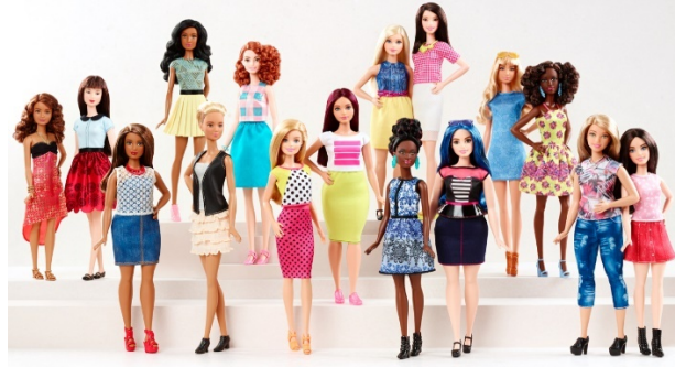
Şekil 4: Moda Tutkunu (Fashionistas) Bebekler (www.barbiemedia.com)