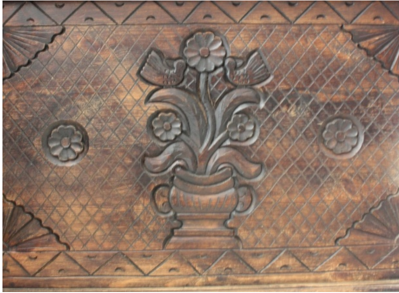
Resim 8: Ahşap oyma sandık detayı "vazoda çiçek" motifi (Yazar, 2108).

Kıbrıs adası tarih boyunca batı arasındaki ticaret yolu üzerinde yer almıştır. Bu ticaret trafiği kültürde, sanatta ve yaşam biçiminde bir bilgi alışverişine olanak sağlamıştır. Kıbrıs sandıklarındaki süslemeler incelendiğinde, bu zengin dokuyu görmek mümkündür. Kıbrıs sandıklarında öne çıkan motifler; çiçekler (buket veya vazoda çiçekler), güneş, haç, svastika, yıldız, ay (hilal), ağaçlar (servi, hurma veya palmye, asma-üzüm), hayat ağacı, kenger yaprağı motifi, kuşlar (güvercin, kumru, kartal), ejder-arслан, yapı ve yapı elemanları (ev, camii, kapı ve kemerler) ve kenar su motifleridir.