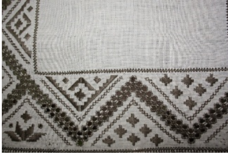
Resim 1: Lefkara “dere deseni” örneği (Yazar, 2018).