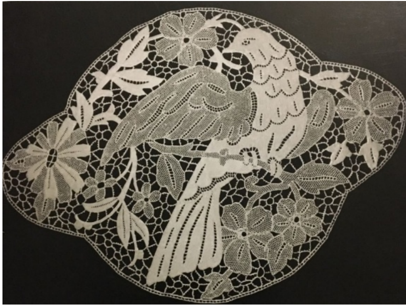
Resim 4: İğne danteli "kuşlu motif" örneği (Yazar, 2018).