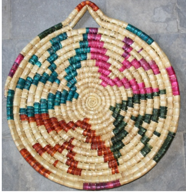
Resim 10: Sesta işi “yıldız” motifi (Yazar, 2108).

kevgir, bacak, ahretti, merdiven (skalavadi), çarkifelek, servi, Gönendere örneği, keçi izi, zencir, lamba (karpuzlu lamba), saksıda çiçek, güneş, dal, çanta, sepet, kartal, mekik, yıldız, gülümdanlık (Görneç), orta yol gibi motifler yer almaktadır. Günümüzde en çok işlenen motifler ise saksıda çiçek, karanfil ve kevgir motifleridir. Sıklıkla işlenen motifler, piyasadan gelen talep üzerine belirlenmektedir. Yapılan bir diğer araştırmada, 1950'li yıllarından sonra Kalem İşleri'nin Kıbrıslı Türkler tarafından daha yaygın olarak yürütüldüğü tespit edilmiştir.