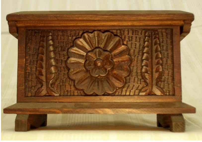
Resim 9: Ahşap oyma sandık “çam ağacı ve çiçek” motifi (Halk Sanatları Derneği, 2018).