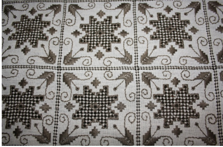
Resim 2: Lefkara “yıldız kare” desen örneği (Yazar, 2018).