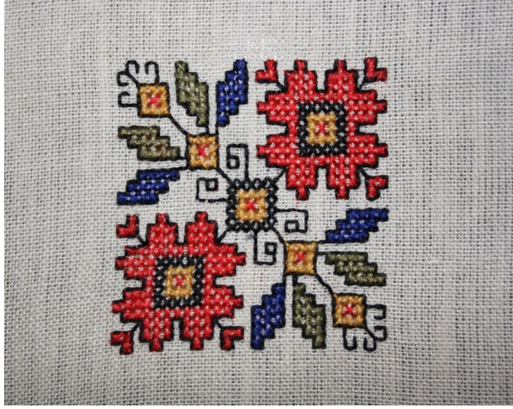
Resim 3: Lapta işi “kutulu desen” örneği (Yazar, 2018).