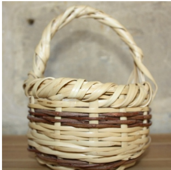
Resim 13: Kalem örmeciğili sepet örenği (Yazar, 2018).