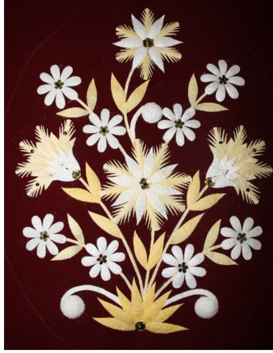
Resim 6: Kozak işi örneği (Yazar, 2018).