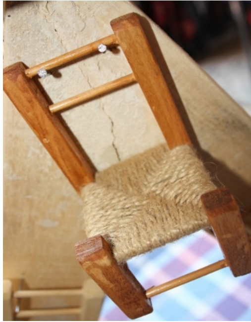
Resim 12: Saz örmesi iskemlesi (Yazar, 2108).

sele-sepet, sandalye ve teraslarda gölgeli ortam yaratmak için çatı süsleridir. Örücülük, yaygın olarak Serdarlı ile Yayla köylerinde yapılmaktadır. Kıbrıs Türk kültürüne özgü Sesta, buğday saplarının farklı renklerde kök boyalar ile boyanmasından sonra örülmesi işlemidir. Sesta örücülüğü, özellikle sele ve sepet yapımında yaygın olarak kullanılmakta olup, yıldız, çiçek, geometrik desenlerin olduğu yöresel bir el sanatıdır. Saz örücülüğü mesleğinde kullanılan dere sazları, bugün hala yaygın olarak dekoratif amaçlı kullanılmaktadır. Kıbrıs'a özgü donolu (dere sazları), sandalye (iskemle) yapımı, teknolojinin ilerlemesine rağmen hâlâ yapılmakta ve özellikle Kıbrıs kahvehane kültürünün vazgeçilmez bir parçasıdır. Sandalye yapımında, sandalye iskeletinin oturma kısmı sazlarla mutlaka örülerek tamamlanmaktadır. Dekoratif amaçlı olarak kullanılan saz örücülüğü, gündelik yaşamda; ekmeklik, kutu, sini, tepsi, kuruyemişlik olarak karşımıza çıkmaktadır. Kıbrıs Türk kültüründe geleneksel bir meslek olan kamış (kalem) örmeciliği, 1975-1980 yıllarınakadar varlığını korumuştur. Özellikle narenciye bahçelerinin bol olduğu adanın batısında köylüler mahsüllerini bu sepetlerle taşımaktaydılar. Günümüzde teknolojinin ilerlemesiyle, plastiğin piyasada yerini alması, eliş eserlerinin değerinin yavaş yavaş kaybolmasına neden olmuştur.