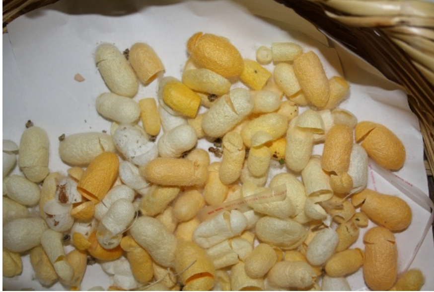
Resim 7: İşlem öncesi ham kozak detayı.