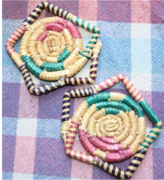
Resim 11: Sesta işi “bardak altlığı” uygulaması (Yazar, 2108).