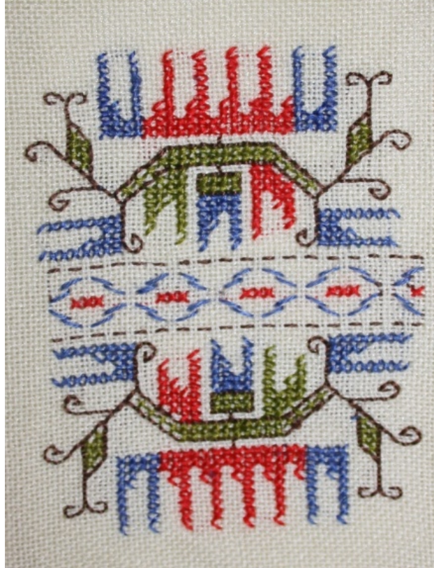
Resim 4: Lapta işi “tarak motifi” örneği (Yazar, 2018).