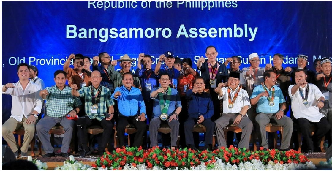
Foto 1: Bangsamoro Çerçeve Anlaşmasına Katılan Başlıca Siyasal Aktörler

Moro İslami Kurtuluş Cephesi'nin lideri Salamat Haşim 71 Müslüman toplulukların isteklerini büyük ölçüde karşılayan Bangsamoro Çerçeve Anlaşmasını şu sözlerle değerlendirmiştir: “Güney Filipinler’de Bangsamoro Müslümanlarının verdiği silahlı mücadele ne sadece Moro Müslümanlarının toplumdaki meşru konularının mücerret bir savunmasıdır ne de gasp edilmiş topraklarında somut bir arazi sahipliği davası veya meşru bir özerklik meselesidir. Bilakis, Bangsamoro Müslümanlarının kendi vatanlarında İslam adına kendi ayakları üzerinde kuracakları bir yönetim sisteminin inşası mücadelesidir.” 72