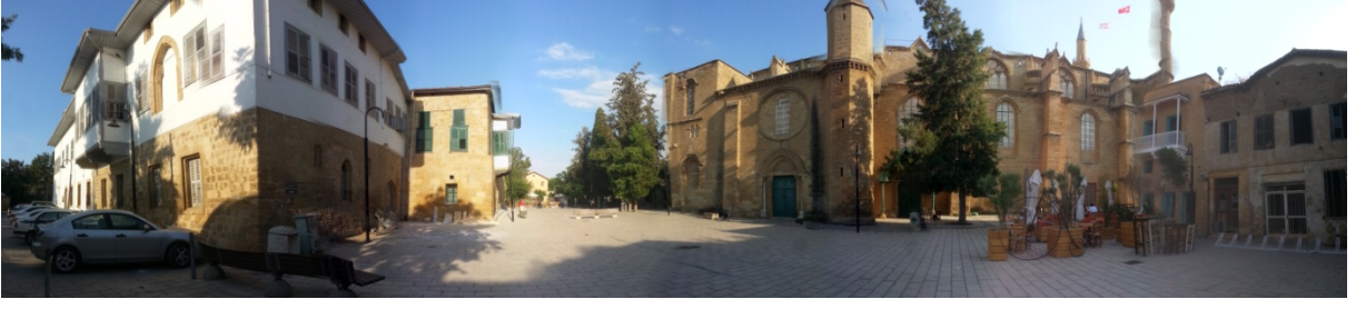
Şekil 16. Günümüzde Selimiye Meydanı (Web 2)