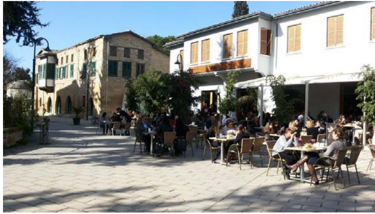
Şekil 15. Selimiye Meydanı Dokusuna Eklenen Yeni Yapı (Web 1)

Meydan, Birleşmiş Milletler'in maddi katkıları ile 2000 yılında başlayıp 2001 yılında tamamlanan yayalaştırma çalışmalarıyla düzenlenmiş ve araç trafiğine kapatılmıştır (Şekil 16). Böylece meydan kullanımında değişim başlamış, buradaki lokanta ve bar işlevlerinin açık alanları meydana taşırılarak, daha çok insanın hizmetine sunulmuştur. Çeşitli özel günlere, festival ve sergilere ev sahipliği yapan meydan, kentin sosyal etkinlik ve buluşmalarına olanak sağlayan bir alan olarak varlığını sürdürmüştür (Şekil 17, 18, 19, 20). Selimiye Meydanı ve tarihi çevre dokusu, buradaki iki müze, yerel el sanatları imal-satış yeri ve yeme-içme mekânları ile iç ve dış turizme de yoğun olarak hizmet vermekte, doku canlılığını korumaktadır.