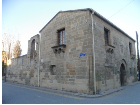
Şekil 4. Venedik Evi (Ç. Özburak - 2018)

Bu dönemde, katedral çevresine eklenen yapılar, tarihi çevre oluşumuna katkı yapmış, Selimiye Meydanı için de çevre sınırları oluşmaya başlamıştır.