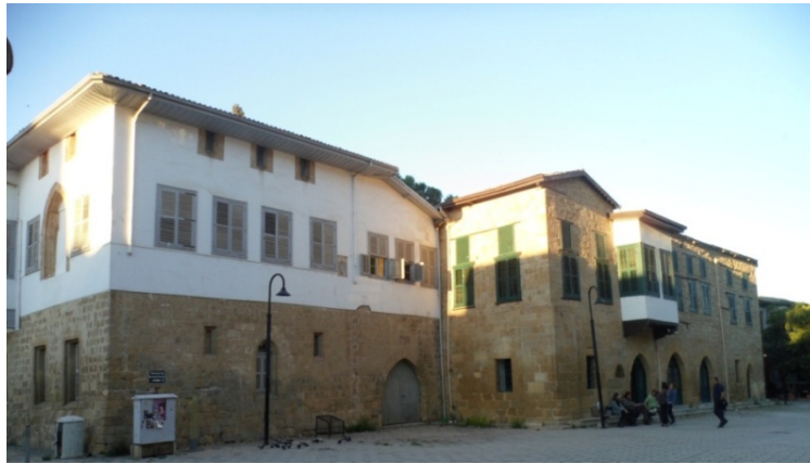
Şekil 7. Kadı Menteşoğlu Konağı ve Doğu Yanındaki Konak (Küçük Mehmet Binaları)