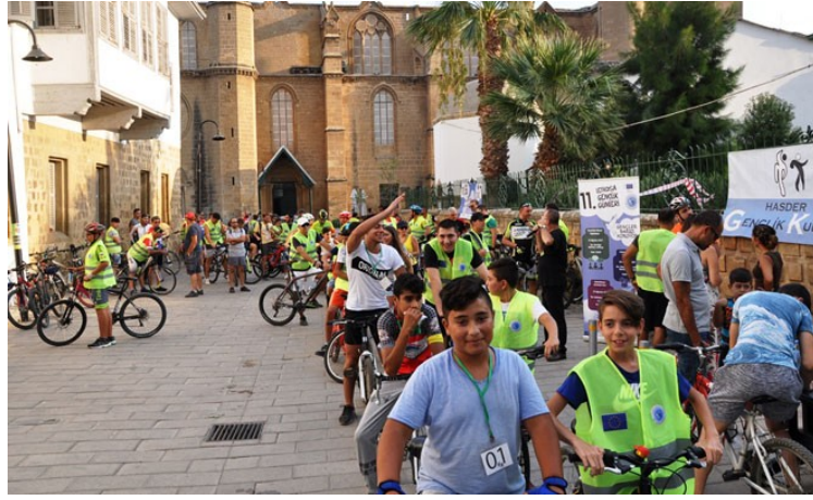
Şekil 20. Hasder Gençlik Kulübü II. Lefkoşa Gençlik Günleri - 20.08.2017