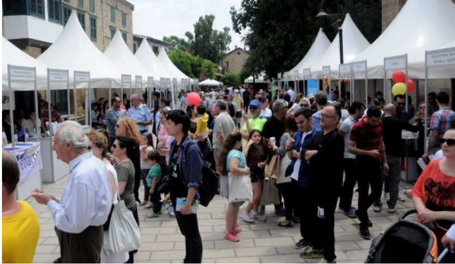
Şekil 18. Selimiye Meydanı'nda Avrupa Günü - 20.05.2017 (Web 4)