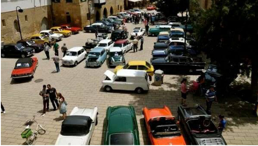
Şekil 17. Selimiye Meydanı'nda KTKOD 5. Klasik Otomobil Sergisi - 03.05.2014 (Web 3)