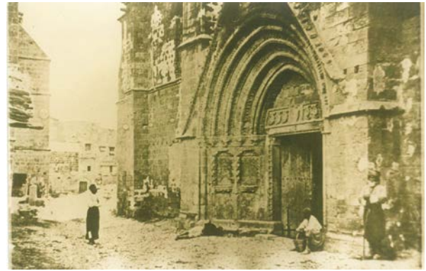
Şekil 6. Bedesten (St. Nicholas Kilisesi) - 1878