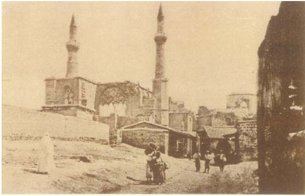
Şekil 5. Selimiye Camii (St. Sophia Katedrali) - 1878

Osmanlı Dönemi, Selimiye Meydanı ve çevresinin oluşumu için önemli bir dönem olmuştur. Bu döneme kadar görülen mimari tarzlara karşın gerek mevcut yapılarda gerçekleştirilen değişiklikler, gerekse yeni inşa edilen yapılarla Türk Mimari eserleri dokuya yerleşmiştir. Sultan Mahmut Kütüphanesi, Geleneksel Türk Evi karakterindeki Kadı Menteşoğlu Konağı, Küçük ve Büyük Medreseler, tarihi çevre oluşumuna katkı sağlamış ve yapılar arasında kalan alan da meydan işlevi ile biçimlenmeye başlamıştır (Şekil 10).