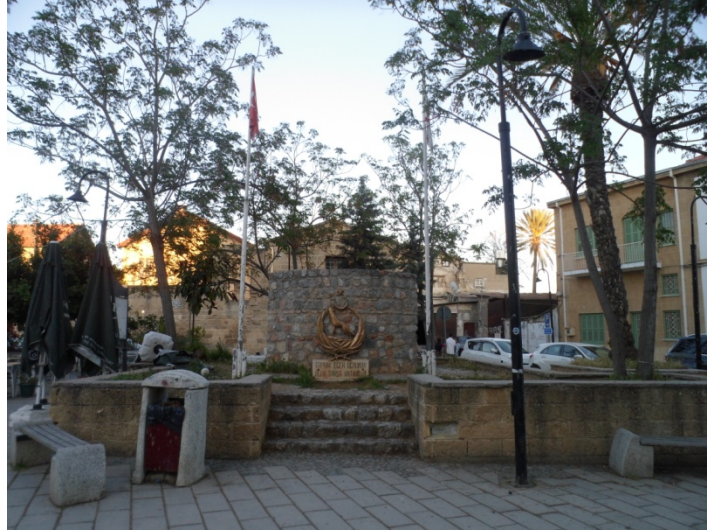
Şekil 13. Mücahitler Anıtı (Ç. Özburak - 2018)

Bu dönemdeki olumsuzluklar ve olanaksızlıklar nedeni ile meydan ve tarihi çevresi için herhangi bir bakım-onarım ve gelişme olmamış, bilakis tarihi dokuda kısmen yıpranmalar görülmüştür.