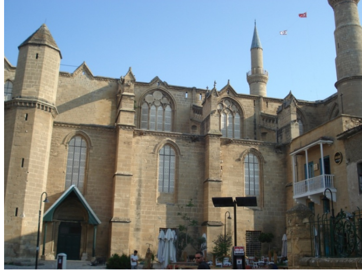
Şekil 14. Selimiye Camii

Bu dönemde meydan çevre dokusuna eklenen yapı, meydanın kuzey yönünde, iki katlı, cumbalı taş konağın doğu yanındaki betonarme yapıdır. Eski bir konağın yıkılmasından sonra buraya iki katlı ve cumbalı olarak inşa edilen binanın zemin katı lokanta, üst katı dernek şubesi olarak kullanılmıştır (Şekil 15).