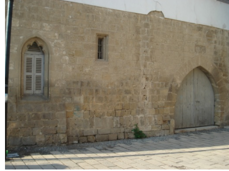
Şekil 2. Latin Başkopsluğu Binası (Z. Turkan – 2018)