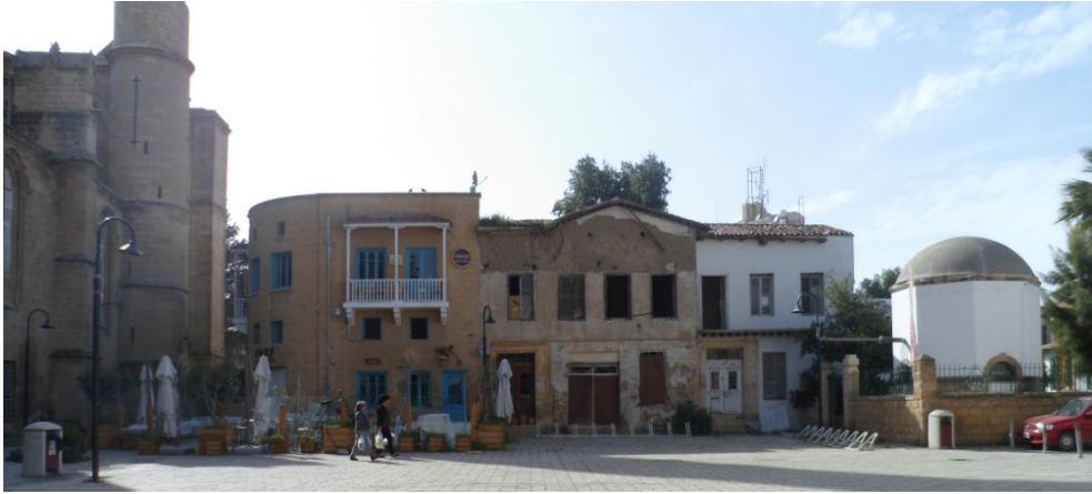
Şekil 12. Meydanın Batı Cephesindeki Konutlar (Ç. Özburak - 2018)