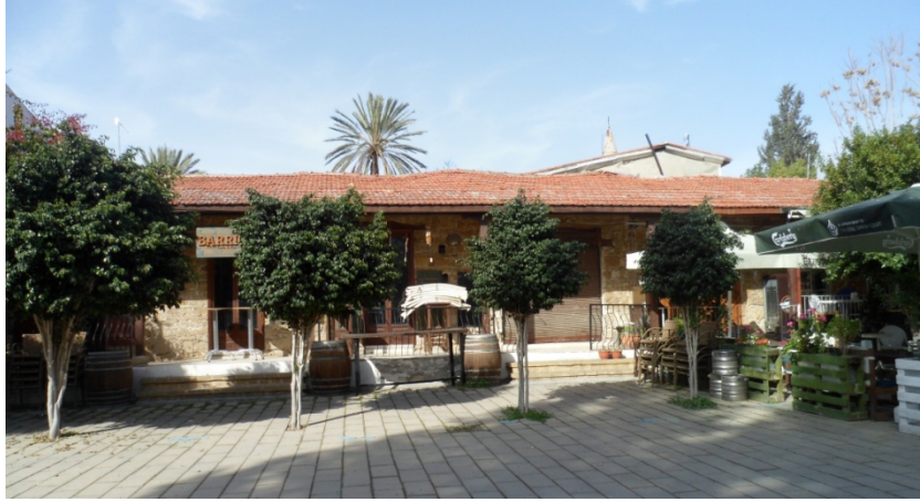
Şekil 11. Sundurmali Sıra Odalar - Din Okulu (Ç. Özburak - 2018)

Kıbrıs'ın İngiliz Dönemi'nin sonu olan 1960 yılına kadar bölgedeki tarihi çevrenin oluşumu ile Selimiye Meydanı biçimlenerek kimlik kazanmıştır. Bu dönemde, Selimiye Mahallesi'nin Lefkoşa'nın dini bir merkezi olması yanı sıra, Selimiye Meydanı da meydan kimliği ile birçok sosyal etkinliğe ev sahipliği yapmıştır.