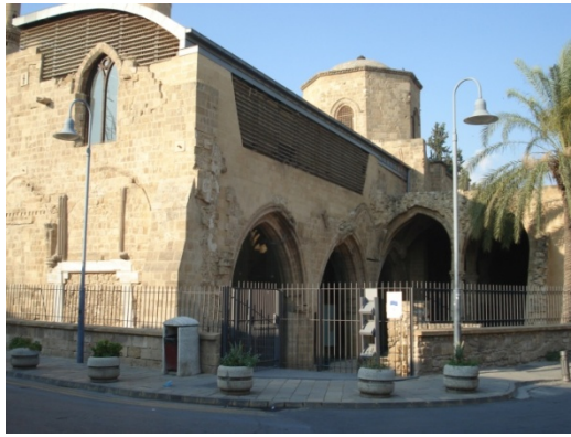
Şekil 3. St. Nicholas Kilisesi (Z. Turkan – 2018)