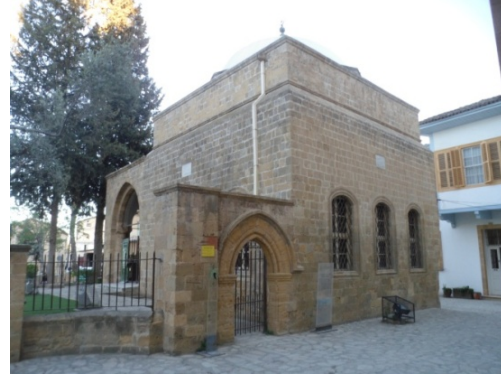
Şekil 8. Ali Ruhi Efendi Çeşmesi (Ç. Özburak-2018) Şekil 9. Sultan Mahmut Kütüphanesi (Ç. Özburak-2018)