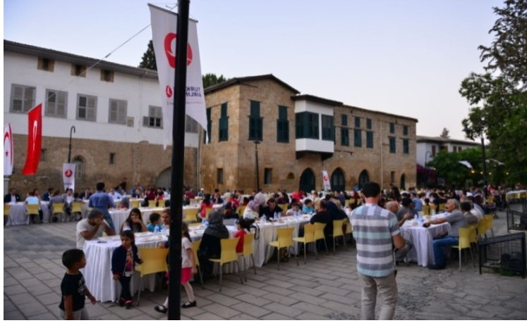
Şekil 19. Selimiye Meyan'nda İftar Yemeği - 25.06.2017