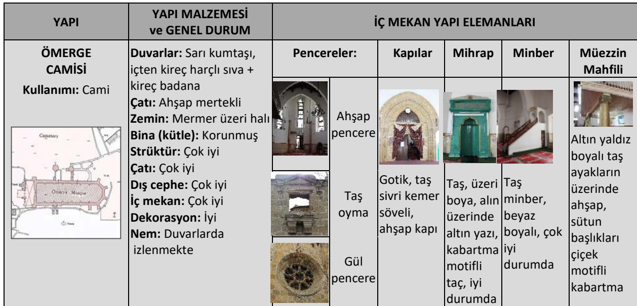
Tablo1. Ömerge, Bayraktar, Tahtakale ve Araplar Camileri yapısal güncel durumlarının analizi

İncelenen yapılardan Ömeriye ve Bayraktar Camileri günümüzde halen ibadet amaçlı olarak kullanılmaktadır. Diğer iki yapı olan Tahtakale ve Araplar Camileri boş durumda olup kullanılmamaktadırlar. Genel yapısal durumu çok iyi olarak değerlendirilen Ömeriye ve Tahtakale Camileridir. Bayraktar ve Araplar Camilerinin genel durumları ise iyi olarak değerlendirilmiştir.