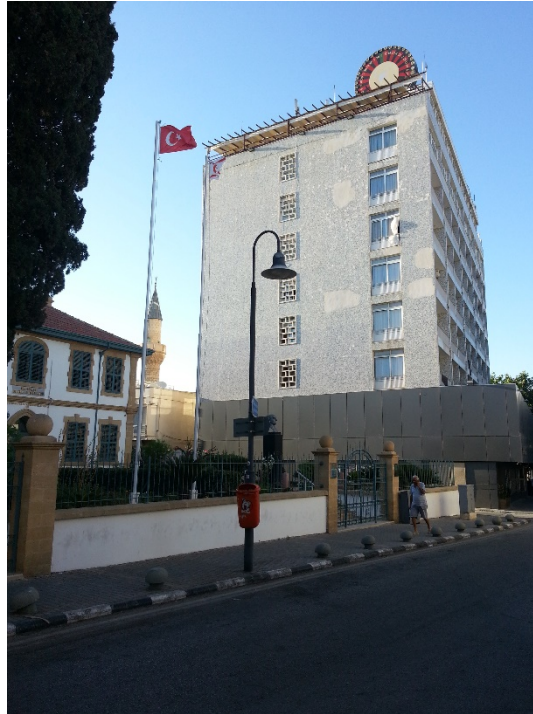
Şekil 3: Saray Otel, Lefkoşa